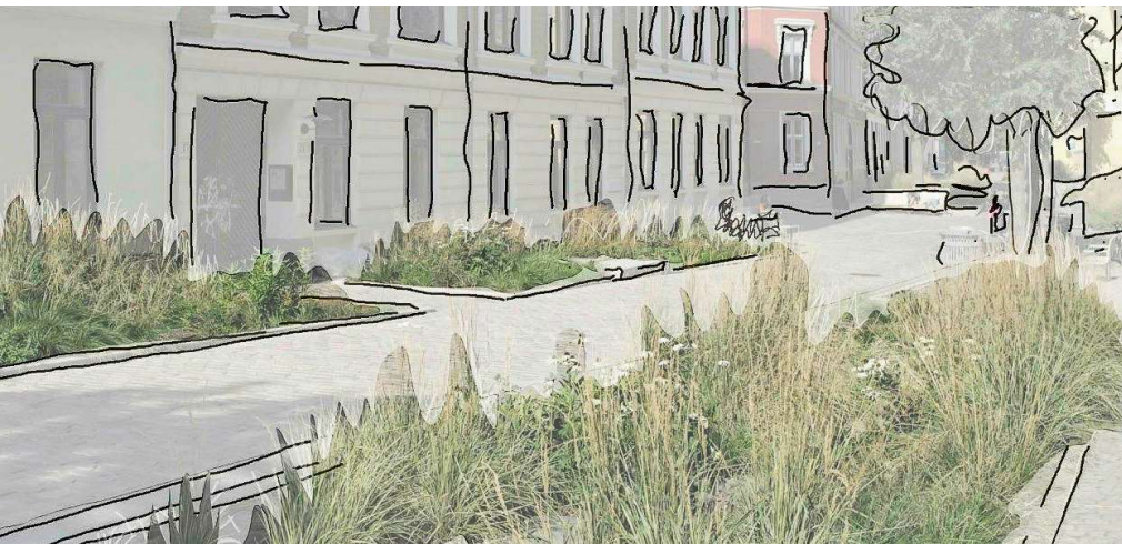
Abbildung 2. Pocket Parks und Bepflanzungen im Strassenraum verbessern die natürliche Retention und Versickerung des Oberflächenwassers. Ist der Anteil an naturbelassenen Bodenversiegelungen hoch genug, differenzieren sie auch das Diffusions- und Absorptionsverhalten des Strassenraums. Zusammen mit dem gepflästerten Boden und den kantigen Mauerwerkfassaden schaffen sie gute Voraussetzungen für Klangqualität.

Bisher waren sich viele Planer und Architekten oftmals nicht bewusst, welche positiven akustischen Wirkungen ihre meist nach visuellen Kriterien entworfenen Bauwerke entfalten. Alle Gebäudefassaden, die einen Aussenraum wie eine Strasse, ein Stadtplatz, eine Grünanlage oder ein Innenhof umgeben, spielen akustisch mit dem Boden dieses Aussenraums zusammen (siehe Abbildung 2).